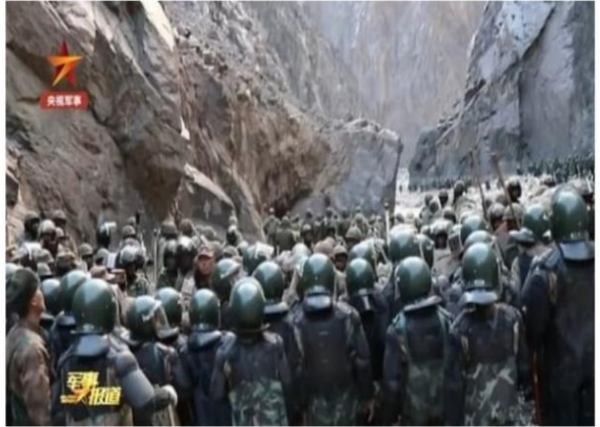
중국, 인도와 분쟁 티베트군구 병사에 자폭장치 달아