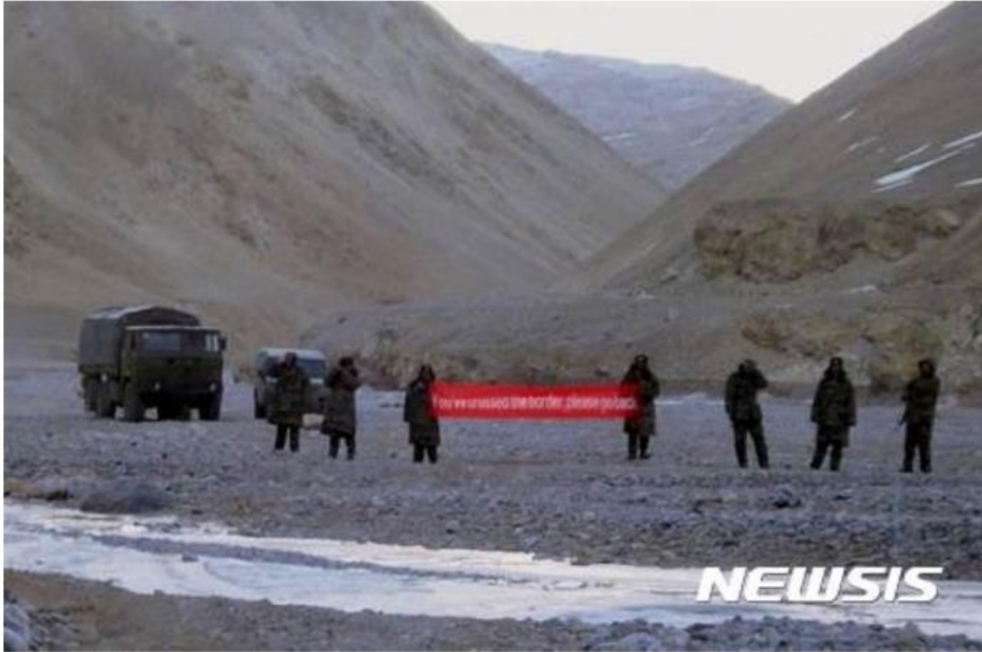
중국군, 인도군 월경에 경고

이들 매체는 중국군이 조기경보기 쿵징(空警)-500과 젠(殲)-10 전투기 수십 대를 티베트 고원 공군기지에 긴급 배치했다며 관련 사진까지 올렸다.