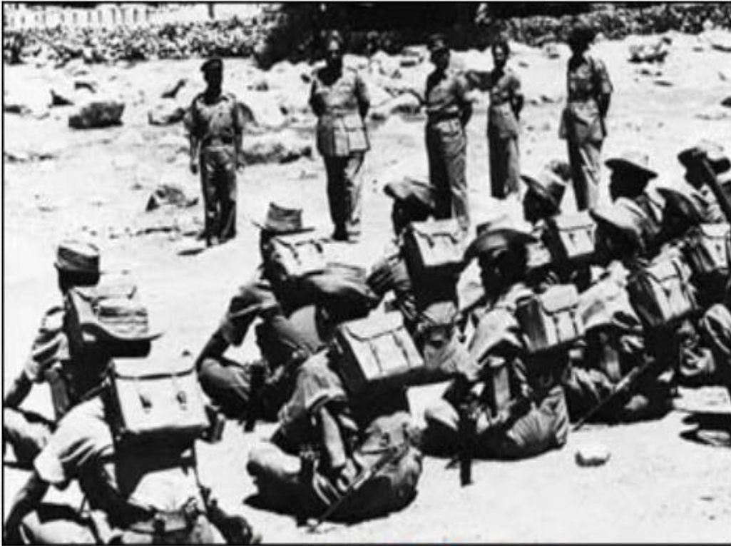
출동 대기 중인 인도군 병사들