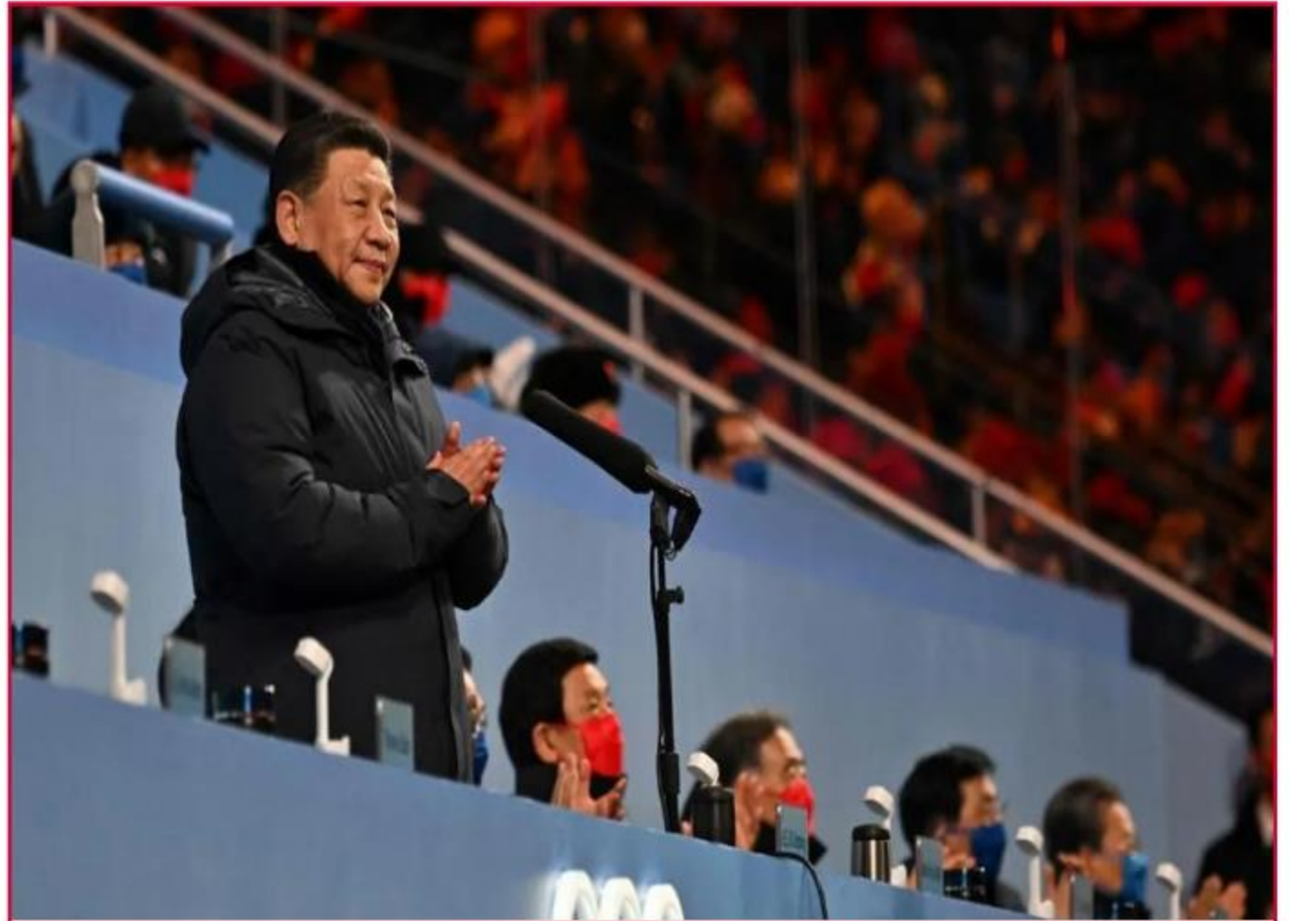
▲ 시진핑 중국 국가주석의 개회 선언

2022 베이징 동계올림픽으로 4년 간 이어지는 동하계 한중일 3연속 올림픽의 마지막이다.