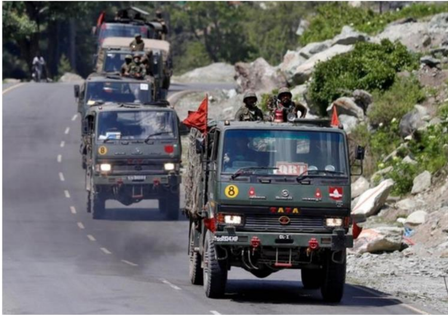
인도군이 지난 18일 히말라야 라다크로 향하고 있다.

인도의 교전 규칙 개정으로 두 나라 사이에 확장(擴戰)을 방지하던 완충 장치가 사라지게 되면서 국경지대 충돌이 더욱 격화하는 게 아니냐는 우려가 나온다.