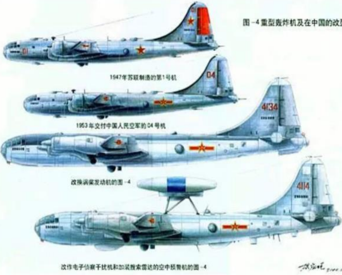
图-4 重型轰炸机及在中国的改型

잘 알려져 있지 않지만, 이 전쟁에서 중국 공군은 B-29를 복제한 소련제 Tu-4를 가지고 폭격기, 정찰기, 수송기, 심지어는 조기경보기로 사용했다. 히말라야 지역에서 제대로 수송이 불가능했기 때문에 이 짝퉁 B-29는 큰 활약을 했고, 덕분에 아마도 이 전쟁은 최후로 B-29가 활약한 전장이라고 볼 수도 있다.