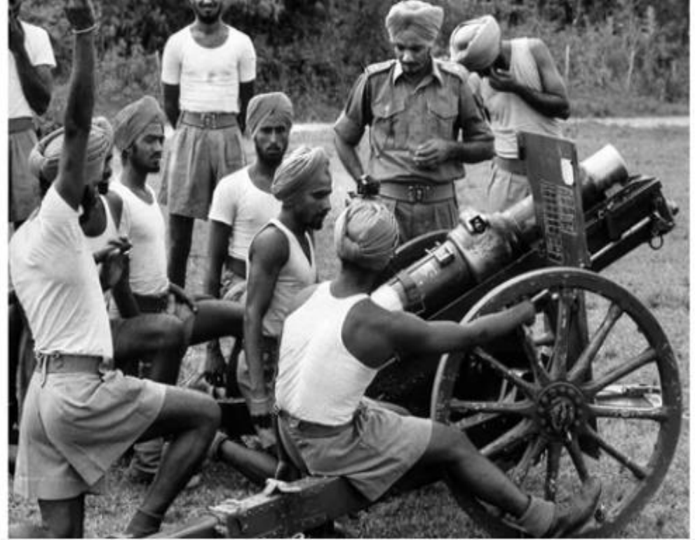
훈련 중인 인도군 포병